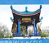
明錫亭(めいしゃくてい)