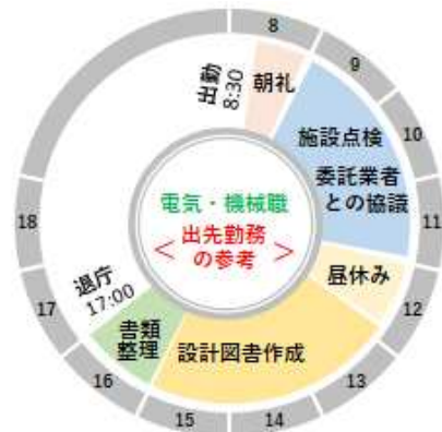
施設の維持管理等を担当する部署