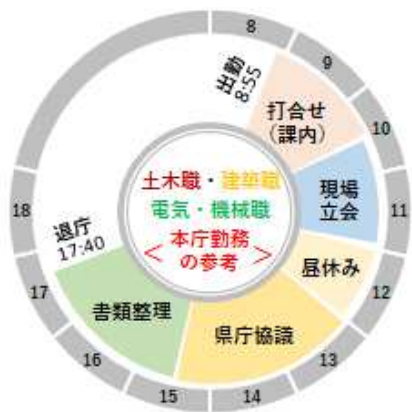
設計や工事等を担当する部署

1日の仕事のスケジュールは、配属される職場によって多少異なりますが、概ね以下のような1日です。