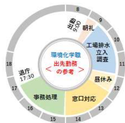
規制・指導や測定等を担当する部署

すべての市民の安全・安心を確保するため未来の投資として、やさしい都市空間づくりに取り組んでいます。