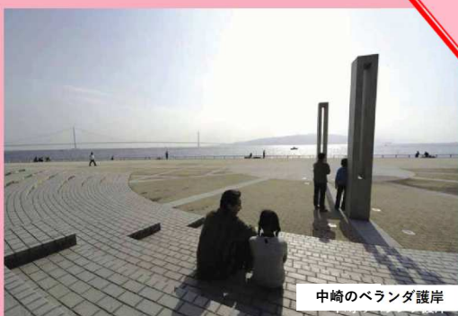
中崎のペランダ護岸