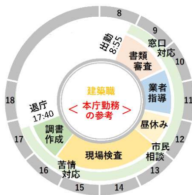
審査・申請窓口等を担当する部署