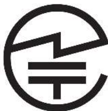
第10の2 - 3 図