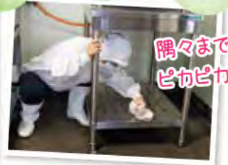
隅々まで ピカピカに