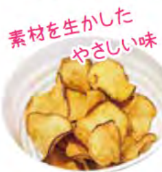
素材を生かした やさしい味

焼き菓子や缶バッジなどの梱包・販売を担当しています。最初は難しい作業も、仲間と協力し合いながらどんどん早くできるようになるのが面白いです。