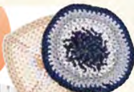
その日の気分で 編むから 全て1点もの

主にアクセサリーや指編みの座布団作りを担当しています。編み物は間違ったらやり直しますので難しいですが、自分の作品が売れたときはうれしいです。