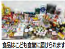
食品はこども食堂に届けられます

家庭の食べきれない食品を持ち寄りください。集まった食品は、市内のこども食堂で活用させていただきます。