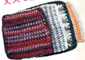
丈夫であっただかい

住所/大久保町大窪2752 TEL 918-5572 FAX 918-5573 予 9:00~16:30