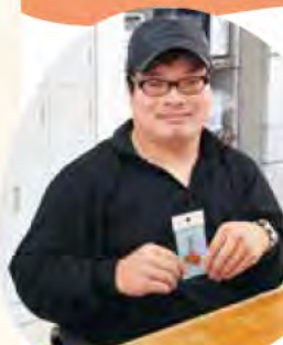
ぬくもりのある 作品がいっぱい

木工雑貨のひも付けや袋詰め、割りばしの梱包作業などを行っています。一つひとつ不良品が無いかチェックして、期間内に仕上げることに達成感を感じます。みんなで作ったものを買ってもらえると嬉しいです。