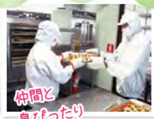
仲間と 息ぴったり