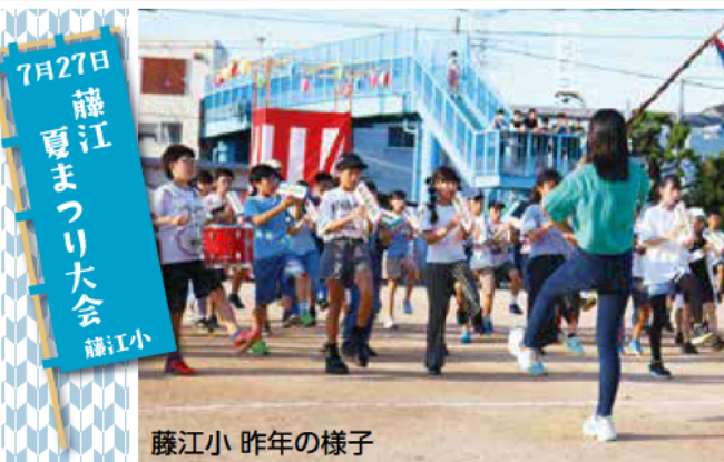
藤江小 昨年の様子