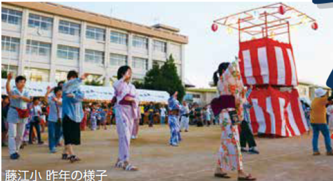
藤江小 昨年の様子