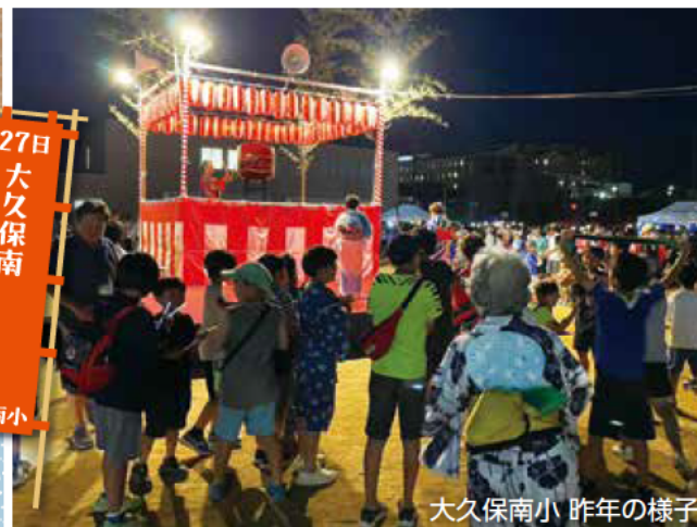
大久保南小 昨年の様子

4面5面 生ごみ処理機の購入に助成金が出ます ほか 6面7面 天文科学館だより ほか 8面9面 情報アラカルト 10面 保健メモ 11面 市民相談 12面 「健康寿命のカギは口にあり!」参加者募集 ほか