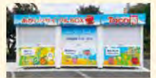
1月に設置されたリサイクルBOX「Taco箱」

豊かな海づくりの推進 1250万円 生物多様性保全の取り組みの推進など 1332万円