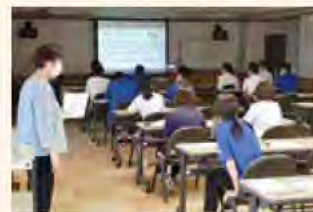
過去の講座の様子