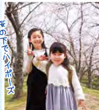
桜の下でハイポーズ