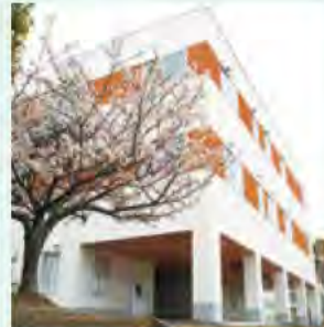
実践的な技術を幅広く学ぶ福祉実習棟