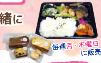
毎週月・木曜日 に販売