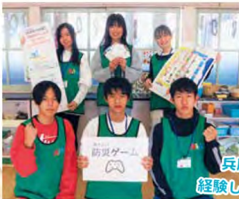
兵庫県南部地震を経験していない世代にも防災の知識を広めたい

主に市内で活動するユース世代の自主活動グループです。災害対応の判断力を養うカードゲームやボードを使って避難所の運営方法を考える防災ゲームを通じ、地域の人と防災について楽しく学んでいます。被災した時の対応について一緒に考えましょう!