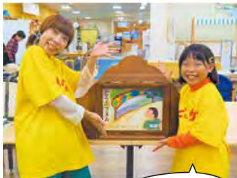
「どうぶつえん」桂文我 脚本 / 加藤休三 絵 (童心社)

絵本を通して笑顔の場所を作れるところが魅力です。自分もやってみたい、やりたいと思う子どもたちが増えてくれるとうれしいですね。