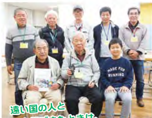
遠い国の人と 交信できたときは、 とてもワクワクします

明石アマチュア無線クラブは1955年に発足し、小学生から80代まで、職業や年齢を問わず、20人が所属しています。