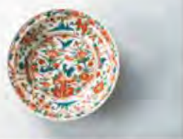
呉州手色絵花鳥文大鉢

観覧料／大人200円、大高生150円(中学生以下無料)、障害者手帳などの提示で半額