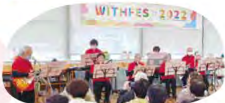
ウィズフェス2022の様子

経験の有無に関わらず、ギター・リコーダー・キーボードなど好きな楽器を使って、幼稚園や高齢者施設などで、楽しく演奏しています。みなさんも演奏をお楽しみください。