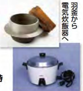
羽釜から 電気炊飯器へ