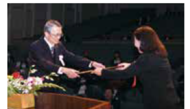
表彰状を受け取る受賞者

11月1日、市政の発展に貢献された人を表彰する「明石市表彰式」を開催しました。式典では、受賞者に表彰状が渡されたほか、明石を訪問中のバレホ