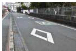
ダイヤモンドの先には横断歩道があります