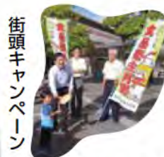
街頭キャンペーン 食の安全・安心情報を発信