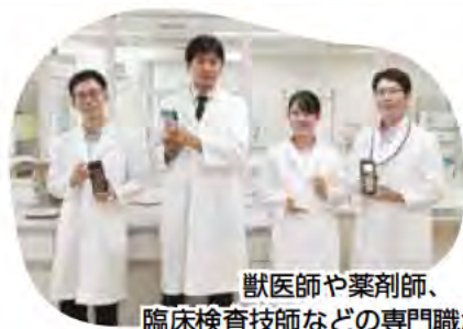
獣医師や薬剤師、臨床検査技師などの専門職が在籍