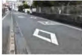
ダイヤモンドの先には横断歩道があります