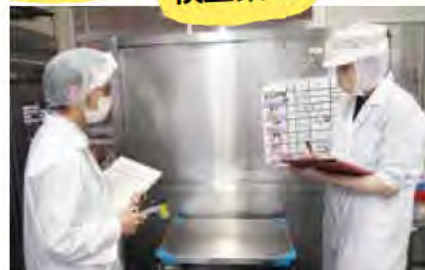
調理施設の調査や指導