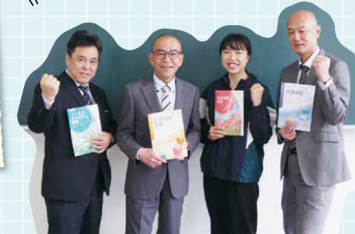
先生たちも福祉科の開設に向けて準備を進めています