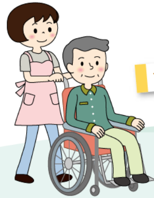
▲ 実習棟イメージ図

2024年4月に明石商業高校に福祉科が開設予定です。福祉の専門科目を学ぶほか、福祉のまちのリーダーとなる人材の育成を目指します。 お問い合わせ