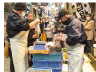
イカナゴを求める 買い物客で賑わう魚の棚商店街

購入した人は 「知人に送るた め、頑張ってく ぎ煮を炊きます」 と笑顔で話して くれました。