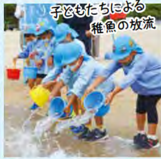
子どもたちによる 稚魚の放流