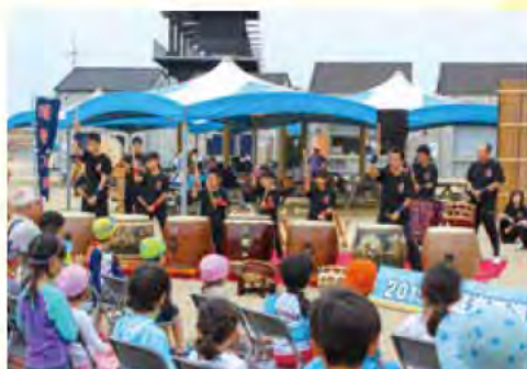
※2019年のオープニングセレモニーの様子