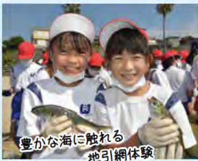
豊かな海に触れる 地引網体験