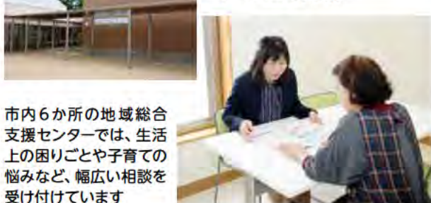
市内6か所の地域総合支援センターでは、生活上の困りごとや子育ての悩みなど、幅広い相談を受け付けています

地域総合支援センターが中立公平で適正な運営を行えるよう、意見や提案をする市民委員を募集します。対象/介護サービス事業者でなく、市内在住の①65歳以上の人、②18～64歳の人 任期/3年 定員/①②各1人 申し込み/応募用紙に必要事項を記入し、「住み慣れた地域で誰もが安心して暮らせるために必要なこと～行政の役割と私に出来ること～」をテーマに800字以内のレポートを添えて、7月15日までに持参または郵送、ファクシミリ、メールで地域共生社会室(〒673-8686 市役所本庁舎1階 TEL918-5289 FAX918-5049 ①sougoushien@city.akashi.lg.jp)へ。応募用紙は同室、あかし総合窓口、各市民センターで配布するほか、市ホームページにも掲載