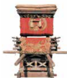
ほたて 穂蓼八幡神社・布団太鼓

期間／12月16日(木)～1月16日(日)午前9時30分～午後6時30分(入館は午後6時まで) ※月曜日と12月29日～1月3日休館(1月10日は開館) 観覧料／大人200円、大高生150円 ※障害者手帳などの提示で半額