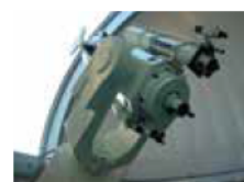
16階天体観測室の反射望遠鏡

日時／①1月8日(土)、②1月29日(土) いずれも午後7時～8時15分(受け付け午後6時30分～) 定員／各20人 料金／1人300円(駐車料金別途200円) 申し込み／①12月25日、②1月15日午後5時まで同館ホームページで受け付け。応募多数時抽選 ※ホームページから申し込みができない場合は電話でお問い合わせを