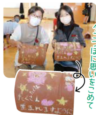
「卵をたくさん産んでね」と タコつぼに思いをこめて