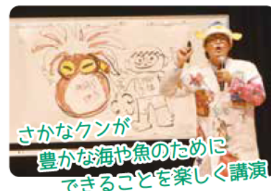
さかなクンが 豊かな海や魚のために できることを楽しく講演

10月17日、市民会館で「明石たこ大使」さかなクンのトークショーが開催されました。得意のイラストを描きながら、タコやタイ、