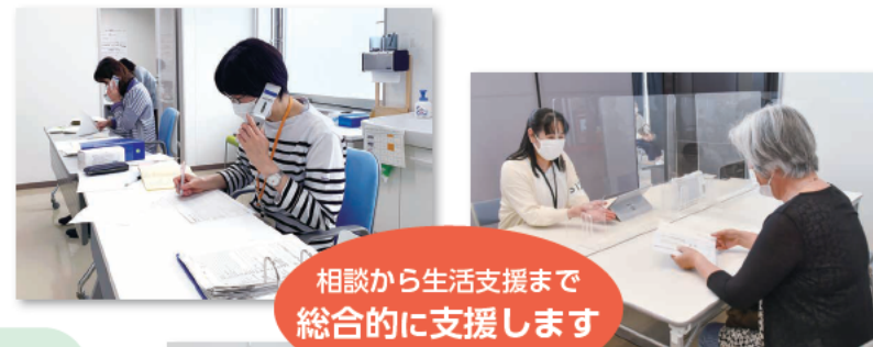
相談から生活支援まで総合的に支援します

追加コメント 市は、新型コロナウイルス感染症に係る予防接種を実施するに当たり、障害、高齢その他の理由によりワクチン接種を受けることに困難、不安等を感じている市民に対して、その者の意向を尊重しながら、その特性に応じた合理的な配慮を行うことにより、希望する全ての市民が安心してワクチン接種を受けられる環境を整備するものとする。