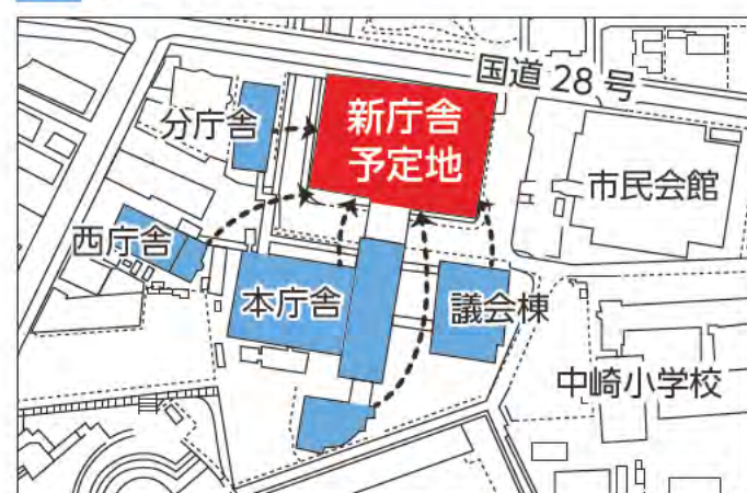
現在の駐車場部分に建設を予定