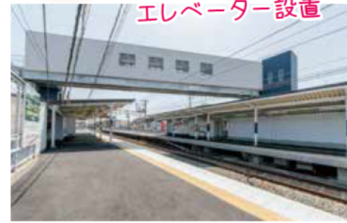
エレベーターが設置され、車いすでの移動も可能に(山陽江井ヶ島駅)