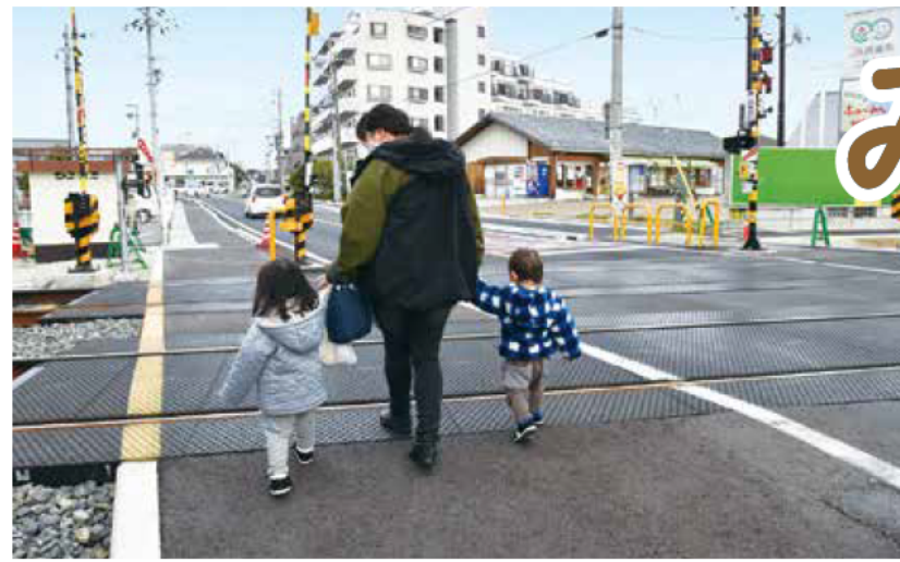
安全に渡れるように踏切を広げ、歩道を設置(東二見農協前踏切)

市は、すべての人が、安心して道路や鉄道を利用できるように、公共交通機関などと共に、“交通バリアフリー”のまちづくりを進めています。今号では、これまでの取り組みや、今後の予定についてお知らせします。