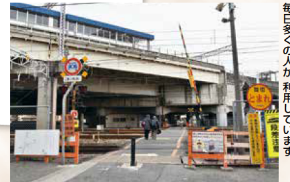
毎日多くの人が利用しています

南畑踏切(小久保)は、距離が長く、通過列車も多い危険な踏切です。安全に横断できるように、2024年3月の完成を目標に、歩道橋(エレベーター併設)を設置することとなりました。