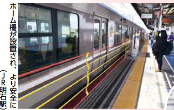
ホーム柵が設置され、より安全に (JR明石駅)

県内で3番目に乗降客数が多い明石駅。現在、新快速や特急が停車する3・4番線にホーム柵が設置されています。今後、1・2番線でも設置を予定。さらに、ホームからの転落が多い西明石駅でも、設置を進めています。