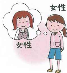
L esbian レズビアン