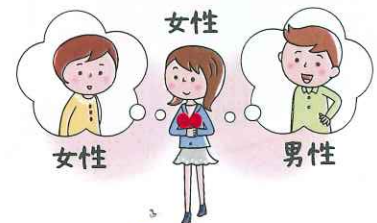
B isexual バイセクシュアル