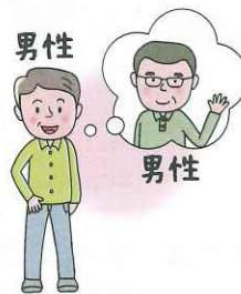
G ay ゲイ