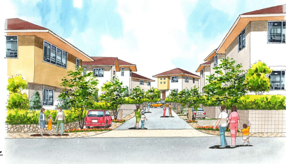
図B まちなみの様子