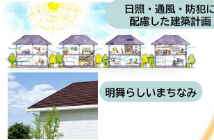
日照・通風・防犯に配慮した建築計画