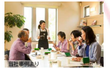
既存コミュニティとの多世代交流