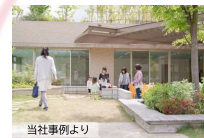
集いの場（集会所・公園）