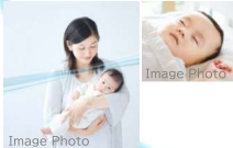
子どもを基準に考えた『空気環境配慮仕様』