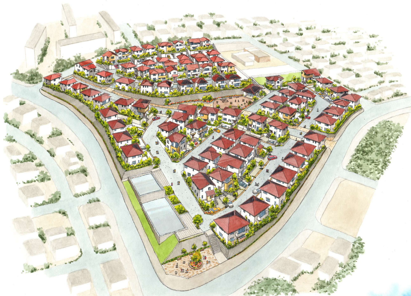
図A 北側からの鳥瞰図