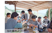
縁づくりのきっかけイベント