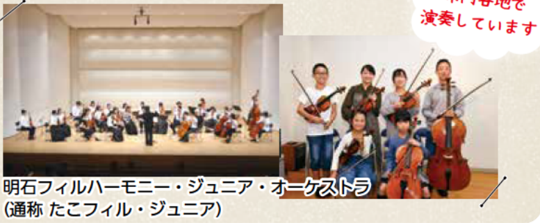
明石フィルハーモニー・ジュニア・オーケストラ (通称 たこフィル・ジュニア)