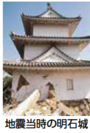
地震当時の明石城

平成7年1月17日に発生した兵庫県南部地震からまもなく25年。近い将来、南海トラフ地震が発生し、明石でも大きな被害が出ると言われています。いつ起きるか分からない地震への備えをお願いします。