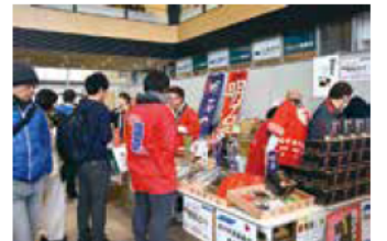
▲5漁協のブランドのりも販売

内容／県内生産量の4割を占める「明石のり」のPR、「利きのり選手権」、明石商業高校の学生が開発した「のりパン」の販売など