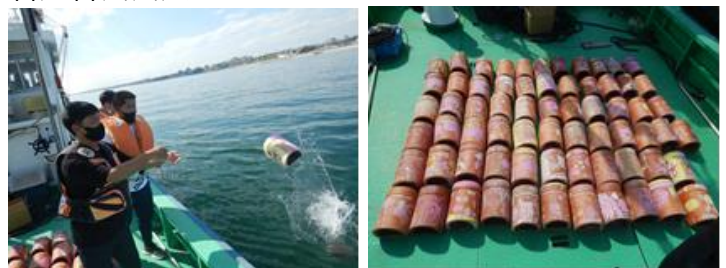
産卵用タコつぼ投入のイメージ