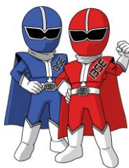
シゴセンジャーレッド、ブルー