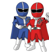
明石市立天文科学館 シゴセンジャーレッド ブルー