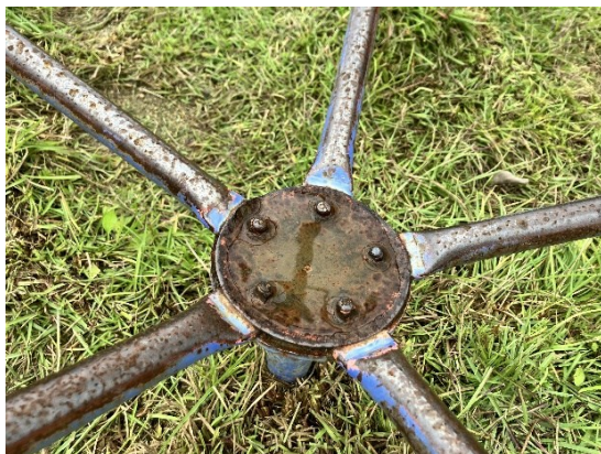
事故の原因となったボルト