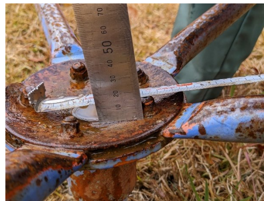
事故の原因となったボルト