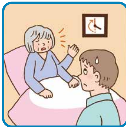
長時間のクレーム