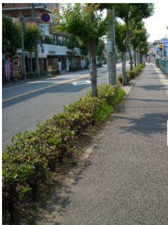
植樹帯による整備例