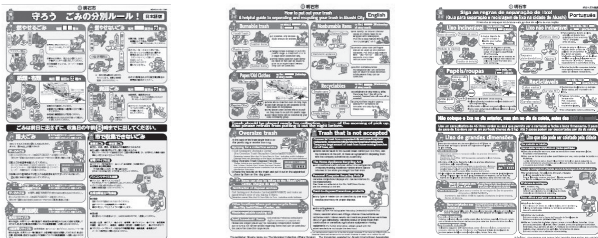
▲多言語で作成されたチラシ（日本語・英語・ポルトガル語ほか9言語に対応）

https://www.city.akashi.lg.jp/kankyuu/shuushuu_jigyuu_ka/kurashi/gomi/manner.html