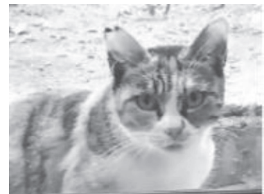
さくら耳を施された猫

当自治会では、数年前より、飼い主のいない猫について、猫の去勢・不妊手術を行ったあと、地域でエサやりなどを管理していく「地域猫」として見守り、猫の数を自然に減らす対策を行っています。しかし、猫によるエサのばら撒き、糞尿の問題等が発生していました。そこで、あかし動物センターが実施する「明石まちなこプロジェクト」(飼い主のいない猫に関する課題解決に向けた新たな取り組み)にモデル地区として参加しました。