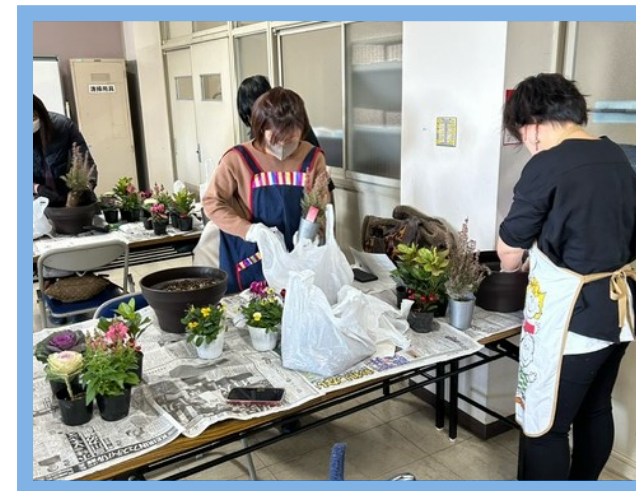
市民講座「家庭を彩る寄せ植えづくり」