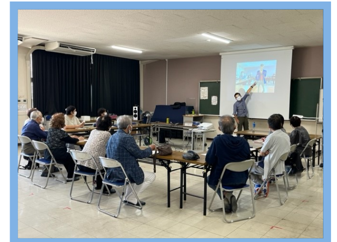
市民講座「誰でも簡単!スマホでもできる ちょっといい写真の撮り方」