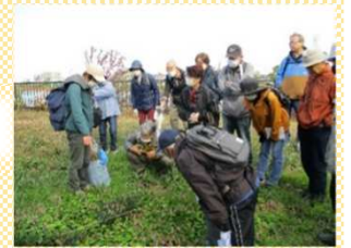
昨年度の「大池の 草花を楽しむ」の 講座風景