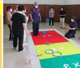
一昨年度の 「ACEボール」の様子 盛り上がりました!