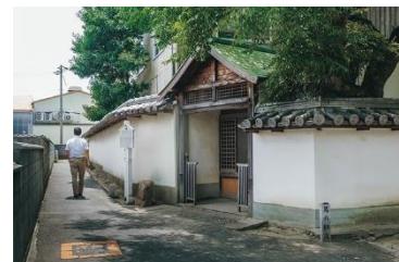
「無量光寺と鳶の細道」 (明石観光協会HP)