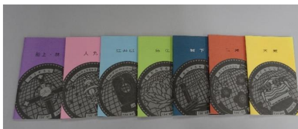
ヘリテージ明石作成の冊子

ヘリテージマネージャーで組織されている「ヘリテージ明石」は、平成25年(2013)より、概ね中学校区を対象として、西国街道沿いの地域を中心として、各地域の歴史的風景を調査している。