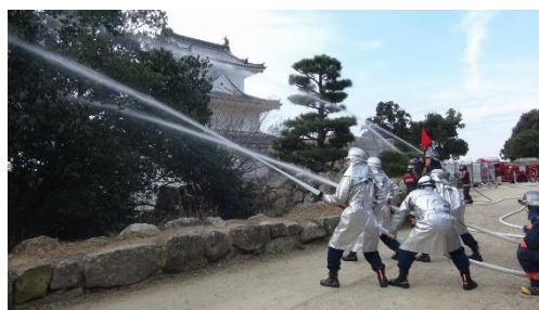
文化財防火デーの訓練の様子（平成 31 年）