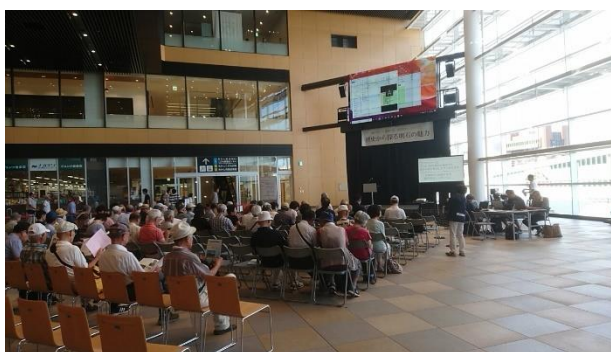
「歴史から探る明石の魅力」 シンポジウムの様子

このように、明石市では、歴史文化に関するシンポジウム等の開催により、歴史文化に関する情報発信を継続している。