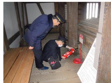
文化財防災・防犯パトロールの様子（令和2年）