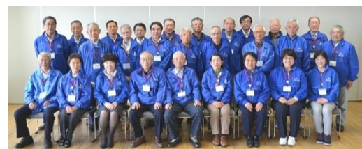
観光ボランティアガイド (明石観光協会HP)