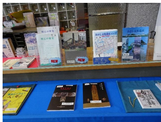
歴史文化に関する刊行物

同冊子では、テーマとして地域に残る独特の祭礼や年中行事、水利絵図や古文書を通じた村の成立、農業技術のあり方や農村の生活実態を聞き取り調査によって把握し、記録化している。対象とした地区は、近世初頭に新田開発で村落を形成した鳥羽地区、松陰新田地区、清水新田地区の 3 地区である。