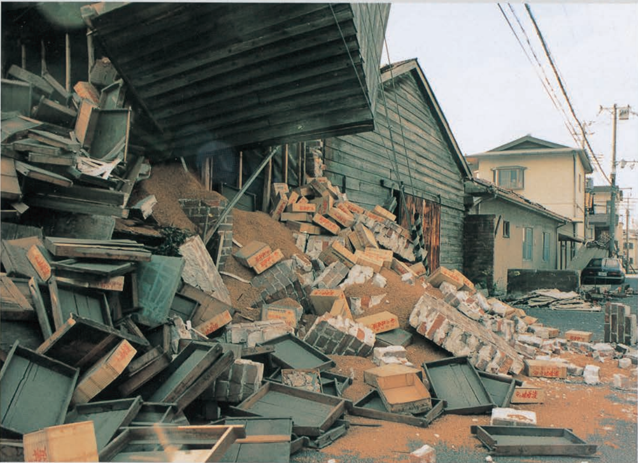
路上にまで倉庫内の積み荷が飛び散った(西新町1丁目)

明石市内の家屋の被災は、阪神間のように目に見える形になりませんでした。建物の外観は保たれているものの、内部や基礎は外観からは見当もつかないほど損壊していたというのが、明石の被災家屋の特徴でした。