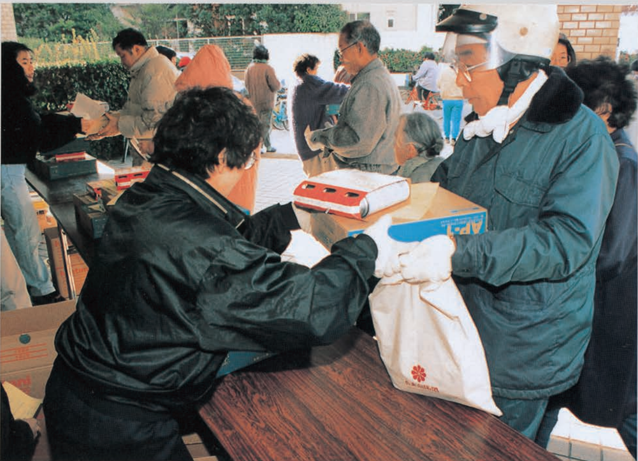
ガスが出ない市民にカセットコンロを配布(市民会館前)