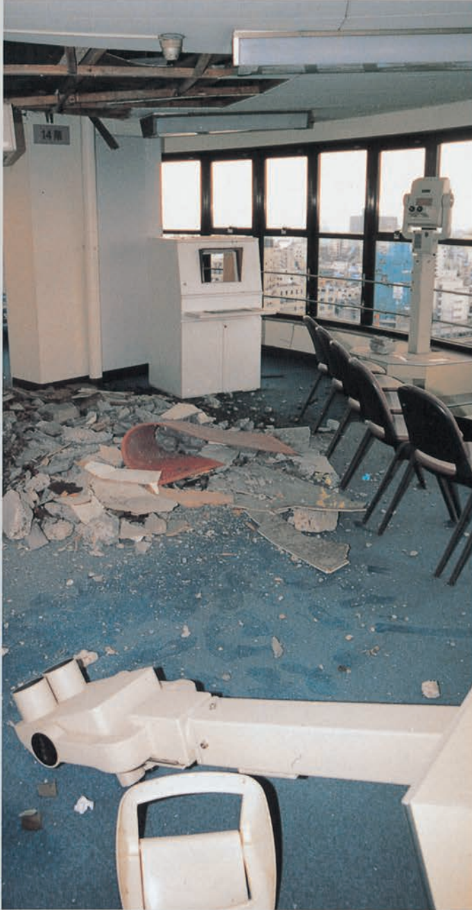
かなりの重量がある望遠鏡の転倒が揺れの激しさを物語る