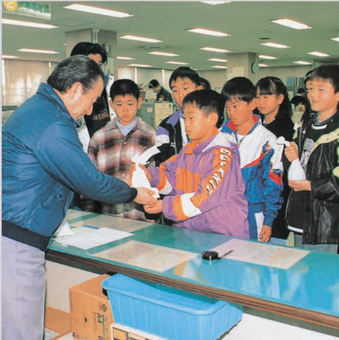
友だちとおこづかいを出し合い、義援金を届けてくれた小学生たち (市役所)