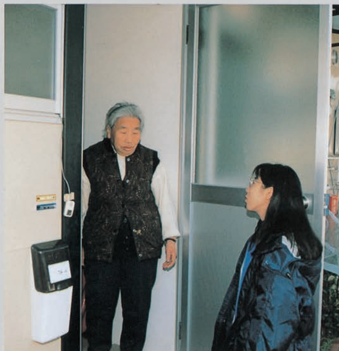
保健婦らが訪問し、高齢者の健康状態を確認（明石公園）