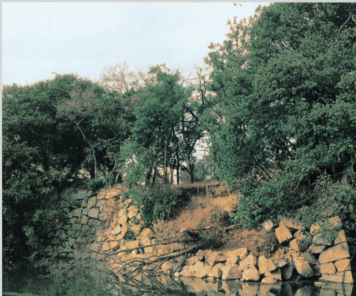
石垣が崩れ落ちた外堀