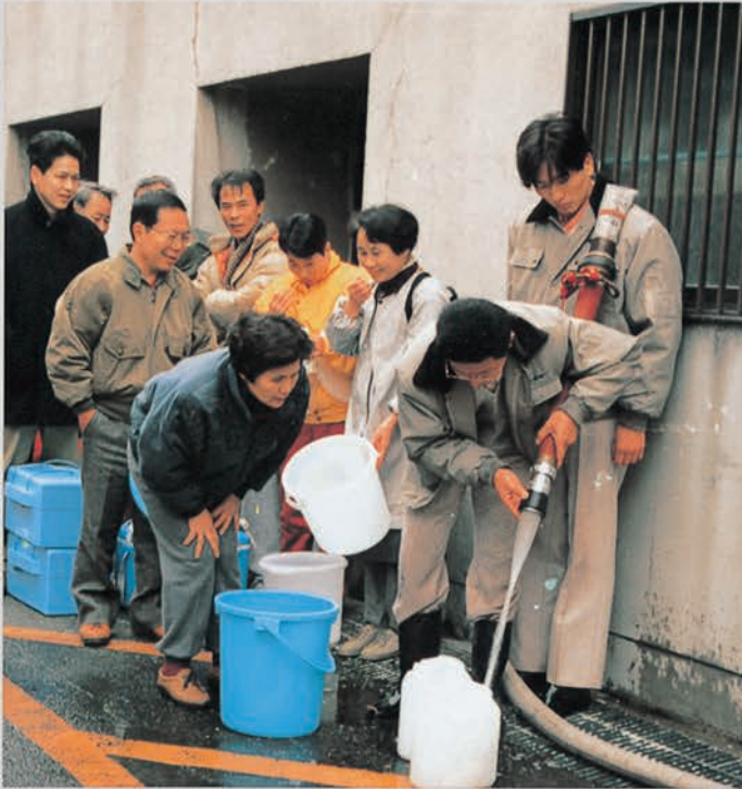
臨時給水場では水を求める市民が途絶えなかった(市役所)

「一刻も早く、好きな物を食べ、お風呂に入りたい」。被災した市民が望んだのは、地震発生まで当たり前のようをしていた事でした。