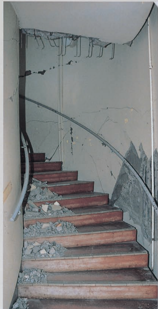
天井や壁が崩れ、鉄筋がむき出しになったらせん階段

しかし、その後の天文科学館再開への道のりは、市民の願いに後押しされるかのように着実に進められました。地震の象徴は、時間の経過とともに、復興の象徴へとなっていました。