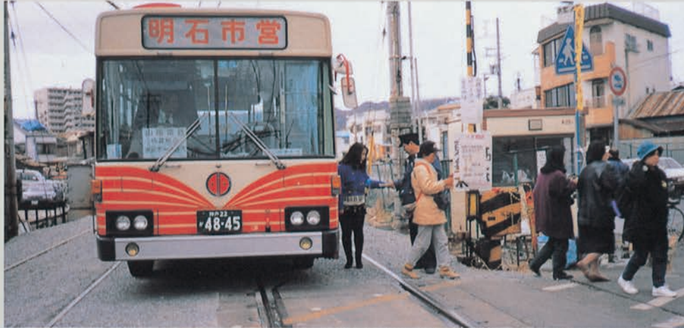
明石市バスは神戸市に鉄道の代替運行便を送り、被災者を助けた(長田区)