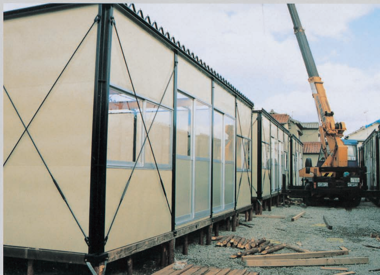
急ピッチで建設が進められた（藤が丘2丁目）

市は、市営、県営、公社、公団住宅など131戸の仮住宅を確保するとともに仮設住宅の建設に着手しました。1月29日午前から中崎1丁目のテニスコートで工事を始めたのを皮切りに、市内13か所で856戸を建設しました。また、仮設住宅への入居が始まった直後から、市と医療、保健、福祉の各機関が連携して「仮設住宅ケアネット」を組織し、高齢者や障害者の支援に取り組みました。