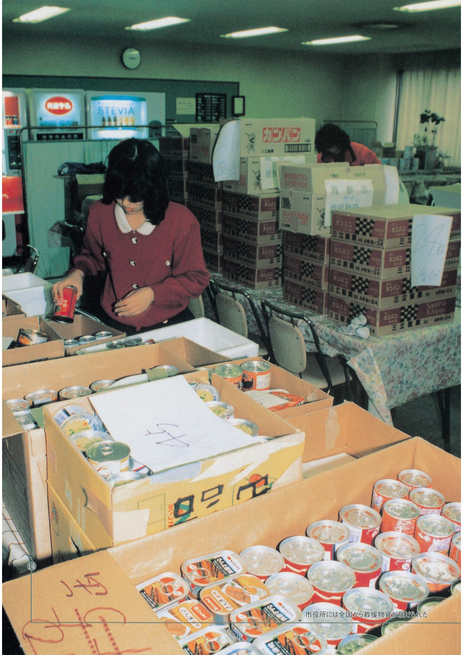
市役所には全国から救援物資が届けられた