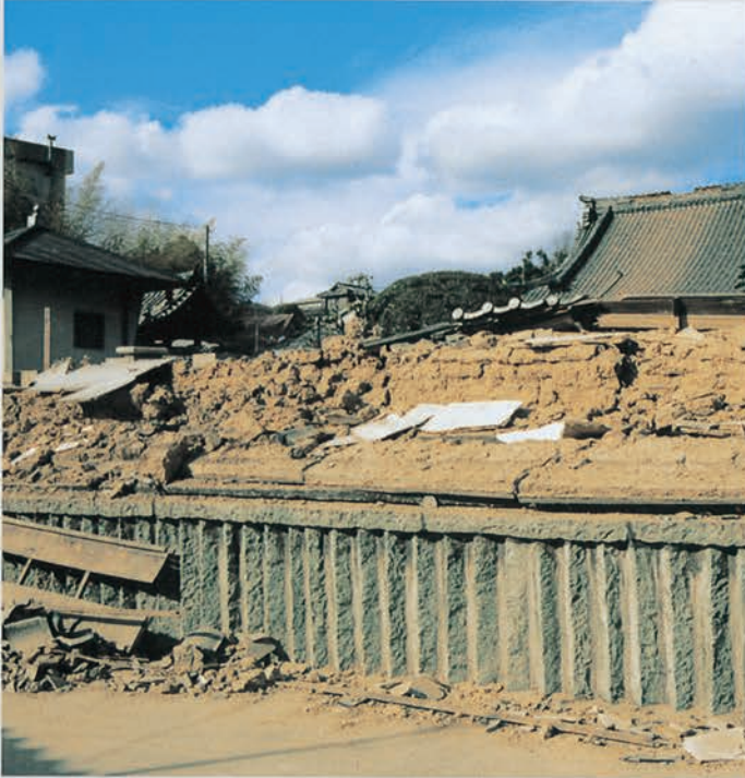
周囲の塀が崩壊した本松寺(上ノ丸1丁目)