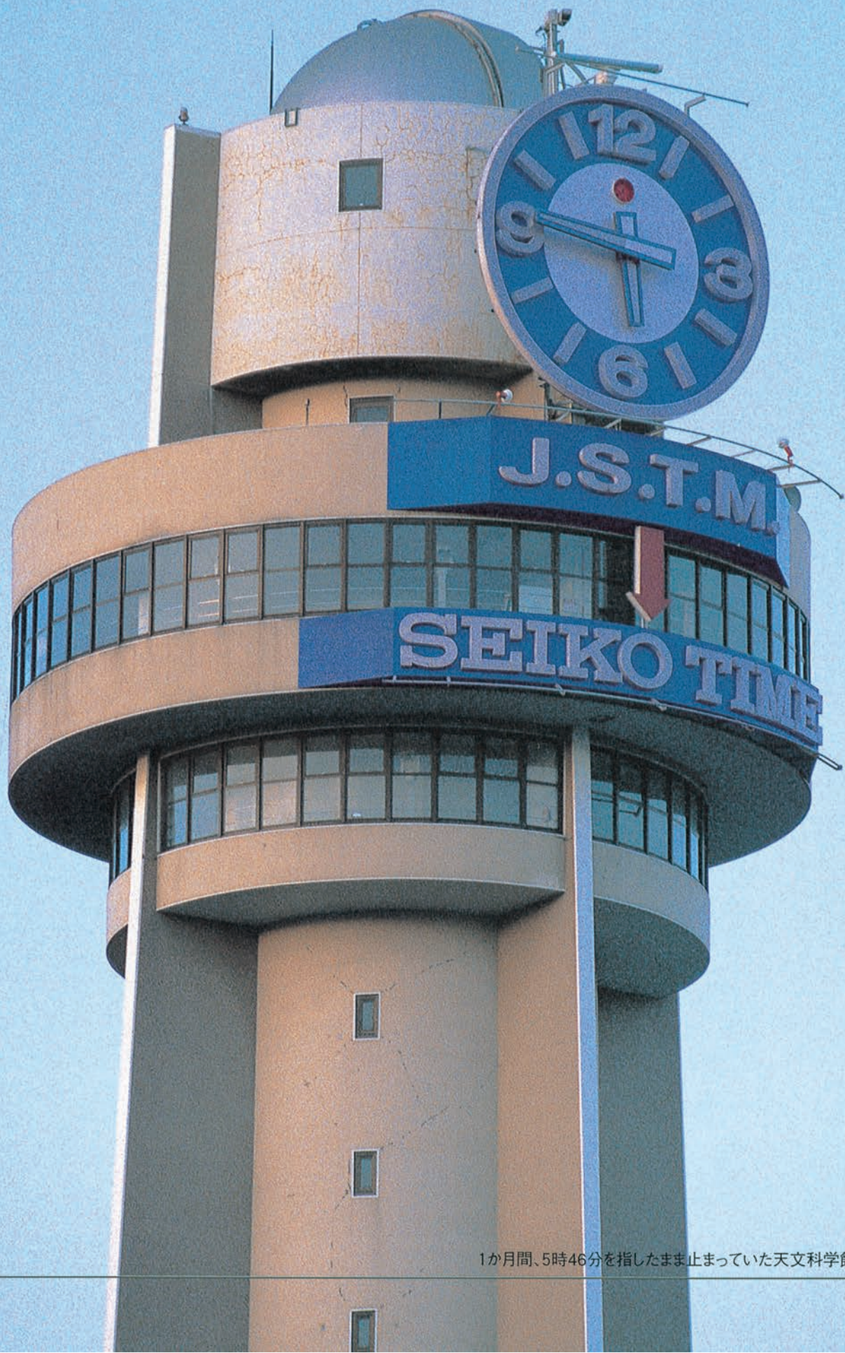
1か月間、5時46分を指したまま止まっていた天文科学館大時計