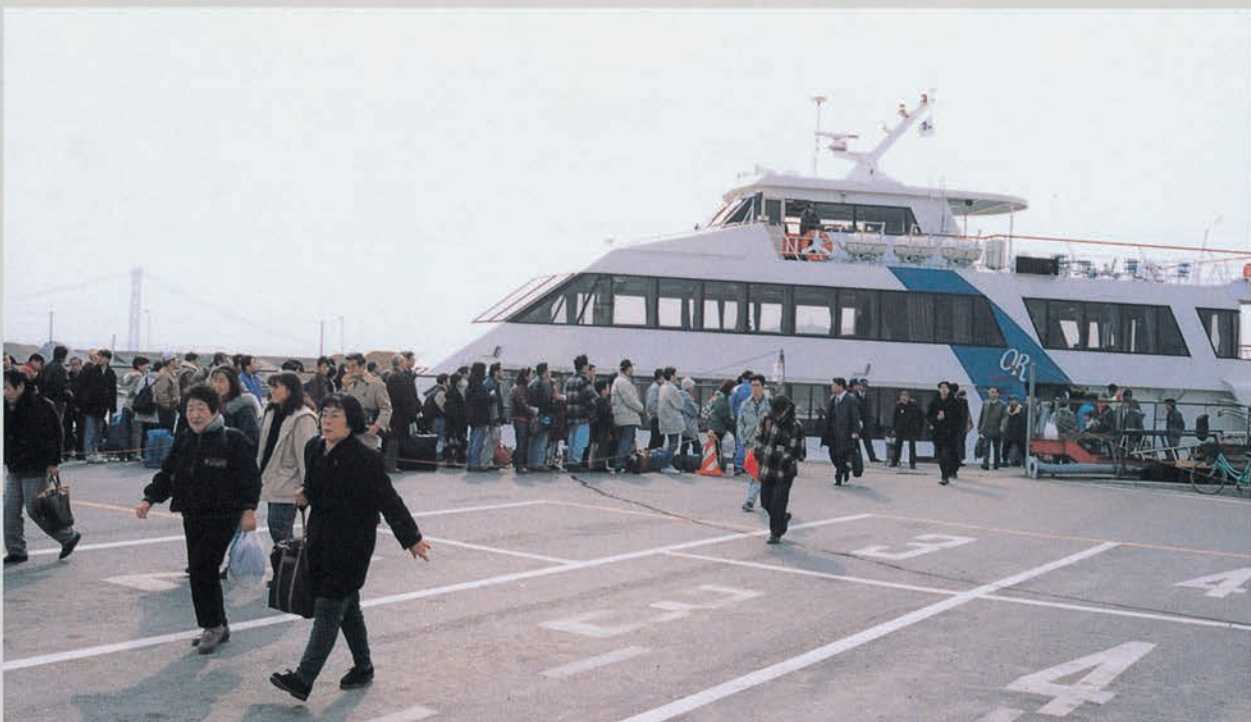
明石港から神戸港へ出航する臨時客船は通勤、通学の貴重な交通手段となった

交通では、鉄道の不通を補うべく、明石港から神戸への臨時客船が運航され、通勤、通学の市民の足を守りました。さらに、市バスは、道路損壊や大渋滞という悪条件の中、翌日の1月18日から一部を除いてほぼ平常運行を続けながら、臨時便も運行しました。さらに市バスは、1月末から3月末まで山陽電鉄(東垂水～西代)やJR(住吉～灘)で鉄道代替バスとして、被災地の交通を助けました。