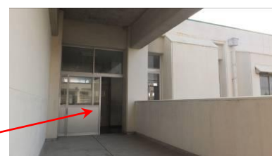
南北校舎の連絡通路