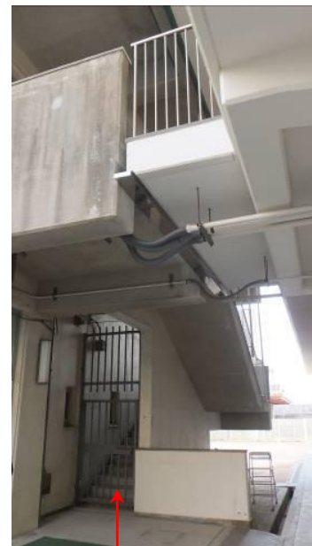
非常階段（解錠必要）