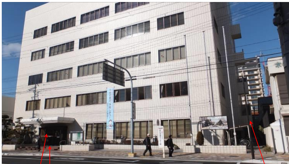
玄関 標識設置位置